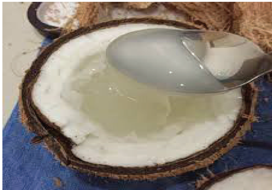
Dừa Sáp - một đặc sản của Trà Vinh.

Dừa Sáp là một giống cây đặc sản đã có từ lâu đời ở huyện Cầu Kè và một số địa phương của tỉnh Trà Vinh, tuy về hình thức không có gì khác biệt so với những trái dừa khác nhưng do điều kiện thổ nhưỡng, khí hậu, thời tiết tại huyện Cầu Kè mà dừa trồng ở đây rất độc đáo: bên trong trái dừa cơm rất dày và mềm dẻo như bột quánh lại, có khi choán gần hết phần không gian bên trong gáo dừa, nước dừa cũng rất ít, sền sệt và trong như sương sa. Có tài liệu cho rằng, cây dừa Sáp xuất hiện ở huyện Cầu Kè khoảng những năm 50 của thế kỷ XX do một nhà sư người Khmer sang thăm Campuchia mang về làm giống, từ đó dừa Sáp trở thành niềm tự hào của người dân vùng sông nước nơi đây. Dừa sáp khi được bổ ra sẽ thấy lớp cơm trắng ngắn, chiếm gần hết phần lõi của quả dừa và một chút nước trong sền sệt, có mùi thơm đặc trưng. Đây cũng là phần ngon nhất của dừa Sáp và cũng là điểm khác biệt rất lớn của dừa Sáp so với dừa thường. Sở dĩ dừa Sáp quý hiếm là vì rất kén đất và khó trồng, vì cùng là loại dừa Sáp nhưng có trái cho sáp, có trái không; hơn nữa cùng một