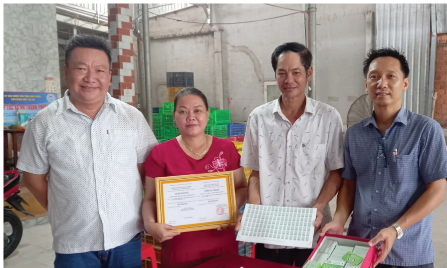
Ban chủ nhiệm dự án trao bộ nhận diện thương hiệu sản phẩm “Chanh không hạt Hậu Giang” cho Hợp tác xã nông nghiệp Thạnh Phước.

Sau 2 năm thực hiện, dự án đã hoàn tất quá trình khảo sát quy mô, hiện trạng, tình hình sản xuất và kinh doanh chanh không hạt, cũng như công tác quản lý và sử dụng nhãn hiệu tập thể “Chanh không hạt Hậu Giang” của Hợp tác xã nông nghiệp Thạnh Phước. Sau đó, tiến hành xây dựng và triển khai áp dụng thành công hệ thống văn bản quản lý nhãn hiệu, xây dựng bộ tiêu chí cho sản phẩm, có thể hiện chi tiết các yêu cầu về nguồn gốc xuất xứ, phân loại sản phẩm, chỉ tiêu cảm quan, hình thức, kích cỡ, trọng lượng quả... Bên cạnh đó, dự án đã đề xuất được mô hình tổ chức quản lý nhãn hiệu phù hợp với điều kiện của Hợp tác xã.