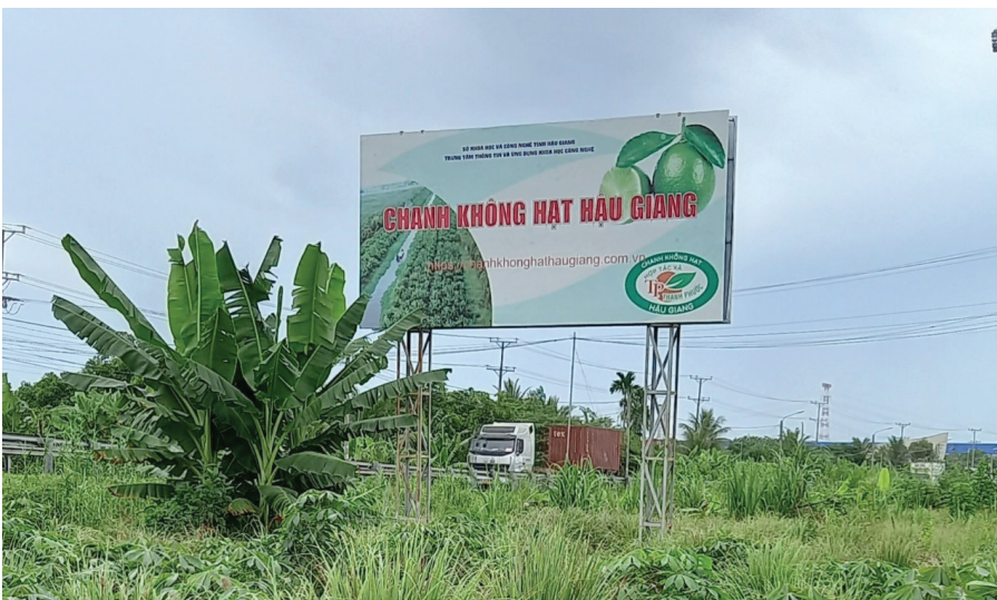
Pano quảng bá “Chanh không hạt Hậu Giang” được lắp đặt tại xã Đông Phú, huyện Châu Thành.

Đặc biệt, sau khi sản phẩm “Chanh không hạt Hậu Giang” được bảo hộ độc quyền thì đã có thêm nhiều hợp tác xã chanh không hạt của tỉnh được hình thành, tiêu biểu như Hợp tác xã nông nghiệp Hiệp Phú với diện tích chuyên trồng chanh không hạt đạt GlobalGAP trên 30 ha, có công ty bao tiêu, xuất khẩu ổn định sang thị trường châu Âu. Bên cạnh đó, hệ thống quản lý và sử dụng nhãn hiệu tập thể “Chanh không hạt Hậu Giang” còn là mô hình điểm để nhân rộng cho các địa phương khác áp dụng trong việc quản lý và phát triển nhãn hiệu tập thể cho các sản phẩm tương tự. Một trong những hiệu quả quan trọng mà dự án mang lại là đã hình thành được một mạng lưới chuyên gia hỗ trợ và hướng dẫn người dân, hợp tác xã trong việc thực hiện các chính sách bảo hộ, quản lý và phát triển tài sản trí tuệ cho các sản phẩm đặc thù, góp phần phát triển kinh tế - xã hội của tỉnh Hậu Giang.