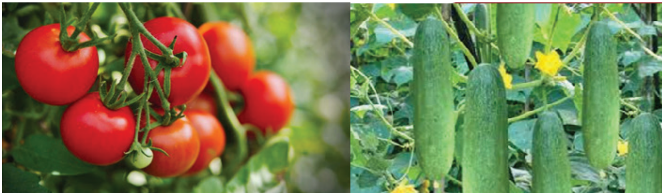
Cà chua và dưa chuột được bón phân hữu cơ ủ từ cá tạp.

2) giảm 100% phân đạm urê, giữ nguyên phân lân và kali theo sản xuất đại trà + tưới 20 lít chế phẩm phân hữu cơ, chia làm 6 lần tưới (mỗi lần cách nhau 7 ngày) với nồng độ 1%; 3) giảm 100% phân đạm urê, giữ nguyên phân lân và kali theo sản xuất đại trà + tưới 30 lít chế phẩm hữu cơ, chia làm 6 lần tưới (mỗi lần cách nhau 7 ngày) với nồng độ 1%; 4) giảm 100% phân đạm urê, giữ nguyên phân lân và kali theo sản xuất đại trà + tưới 40 lít chế phẩm hữu cơ, chia làm 6 lần tưới (mỗi lần cách nhau 7 ngày) với nồng độ 1%. Công thức bón cho cây cà chua cũng được chia tương tự thành 4 loại: 1) bón 100% phân vô cơ (quy trình sản xuất đại trà); 2) giảm 100% phân đạm ure, giữ nguyên phân lân và kali theo sản xuất đại trà + tưới 30 lít chế phẩm phân hữu cơ, chia thành 8 lần tưới (mỗi lần cách nhau 10 ngày) với nồng độ 1%; 3) giảm 100% phân đạm urê, giữ nguyên phân lân và kali theo sản xuất đại trà + tưới 40 lít chế phẩm phân hữu cơ, chia làm 8 lần tưới (mỗi lần cách nhau 10 ngày) với nồng độ 1%; 4) giảm