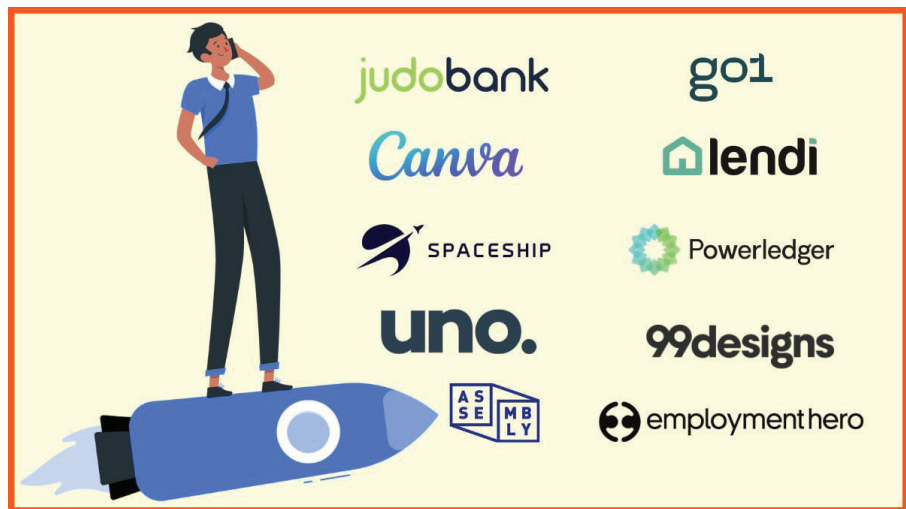
Top 10 công ty khởi nghiệp thành công ở Úc năm 2022.

Bảo hộ KDCN làm tăng giá trị trên toàn bộ quá trình phát triển sản phẩm. Hơn nữa, việc bảo hộ thiết kế kiểu dáng là rất quan trọng đối với công ty khởi nghiệp để phân biệt thương hiệu của