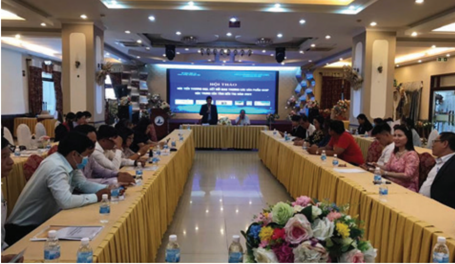
Hội thảo xúc tiến thương mại để quảng bá sản phẩm OCOP Bến Tre.

hợp đồng phân phối sản phẩm, kế hoạch bảo vệ môi trường; hỗ trợ xây dựng, chứng nhận hệ thống quản lý chất lượng để nâng cao chất lượng sản phẩm; nâng cấp bộ nhận diện thương hiệu, truy xuất nguồn gốc sản phẩm. Đề tài đã hỗ trợ xây dựng 30 bộ nhận diện nhãn hiệu của 30 cơ sở; hoàn thiện 10 đơn đăng ký bảo hộ kiểu dáng công nghiệp cho 4 doanh nghiệp.