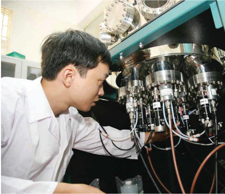
Phòng thí nghiệm của Trung tâm Động lực học Thủy khí môi trường, Trường Đại học Khoa học Tự nhiên, Đại học Quốc gia Hà Nội.

Thông tư số 55 (tăng từ tối đa 200 triệu đồng/nhiệm vụ lên tối đa 300 triệu đồng/nhiệm vụ).