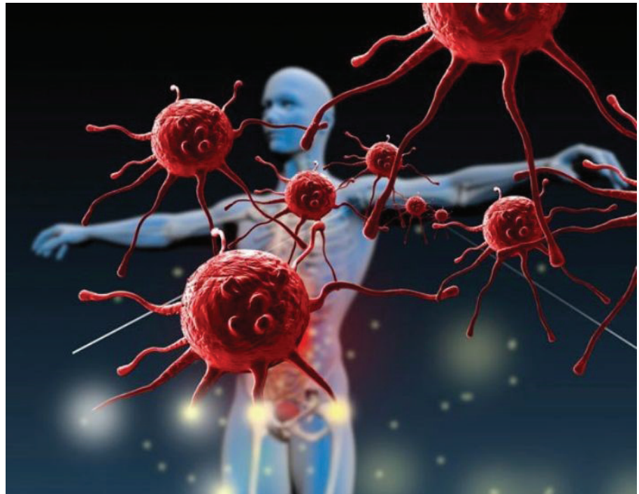
Liệu pháp tế bào miễn dịch có tác dụng làm ngừng hoặc làm chậm sự phát triển của tế bào ung thư.

điều trị hiệu quả nhiều loại ung thư, đồng thời khắc phục được các hạn chế của những phương pháp cổ điển. Một số liệu pháp đã được sự chấp thuận của các tổ chức y tế lớn trên thế giới như