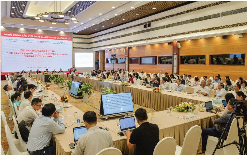
Hội thảo quốc gia “Hệ giá trị quốc gia, hệ giá trị văn hóa, hệ giá trị gia đình và chuẩn mực con người Việt Nam trong thời kỳ mới”, 11/2022.