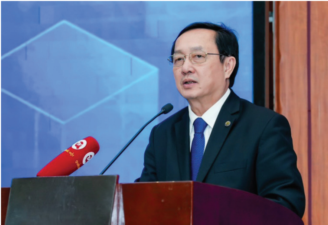
Bộ trưởng Bộ KH&CN Huỳnh Thành Đạt phát biểu tại buổi họp báo công bố PII 2023 (ngày 12/03/2024).

Ở cấp địa phương, do chỉ số GII đánh giá ở cấp quốc gia nên nhiều số liệu thống kê ở cấp địa phương không có. Phương pháp đánh giá theo quy chuẩn quốc tế còn mới nên một số nội dung không tương đồng với thực tiễn tại các địa phương của Việt Nam. Bên cạnh đó, do có sự khác biệt giữa các địa phương về quy mô kinh tế - xã hội (KT-XH), dân số, đất đai, cơ cấu kinh tế, định hướng phát triển..., nên các địa phương sẽ phải lựa chọn mô hình phát triển KT-XH dựa trên KH,CN&ĐMST khác nhau để phù hợp với bối cảnh, điều kiện, đặc điểm riêng. Vì vậy, nhiều địa phương đã kiến nghị cần có bộ PII để có căn cứ khoa học và số liệu minh chứng phục vụ cho công tác chỉ đạo, điều hành phát triển KT-XH dựa trên KH,CN&ĐMST ở địa phương được tốt hơn, sát với thực tiễn hơn.