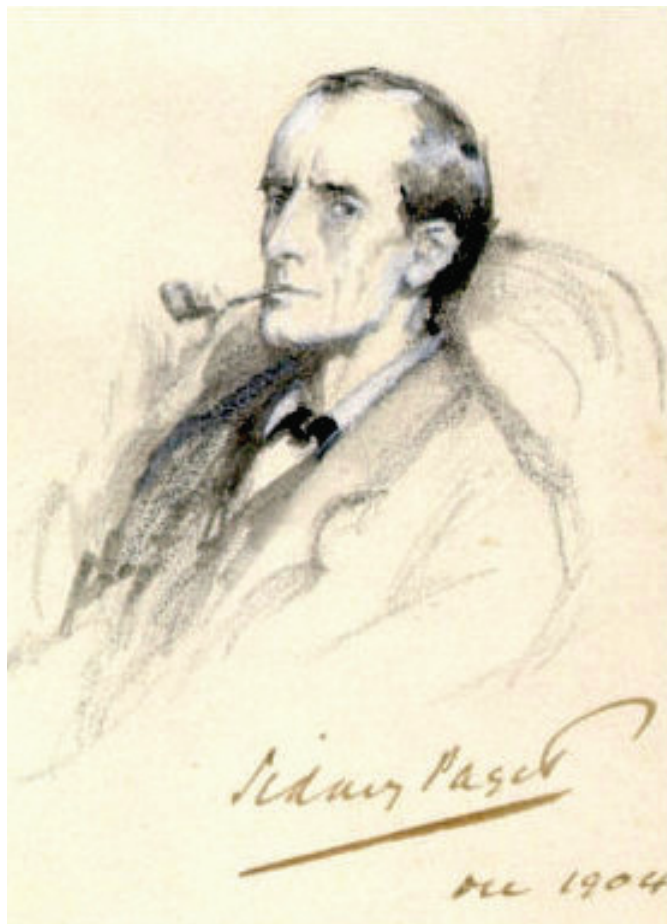
Sherlock Holmes trong một bức minh họa năm 1904 của Sidney Paget.

Khi đồng hồ thế giới điểm sang ngày đầu tiên của năm 2024 cũng là lúc thời hạn bảo hộ bản quyền của chuột Mickey chấm dứt, cho phép bất kỳ ai cũng có thể khai thác và sử dụng hình ảnh chú chuột này vào các tác phẩm của riêng họ mà không phải trả tiền hay xin phép Walt Disney. Điều này cũng tương tự như nhiều nhân vật nổi tiếng khác cũng đã thuộc về phạm vi công cộng như Sherlock Holmes, Dracula. Tuy nhiên, việc khai thác Mickey so với các nhân vật kia lại không hề đơn giản.