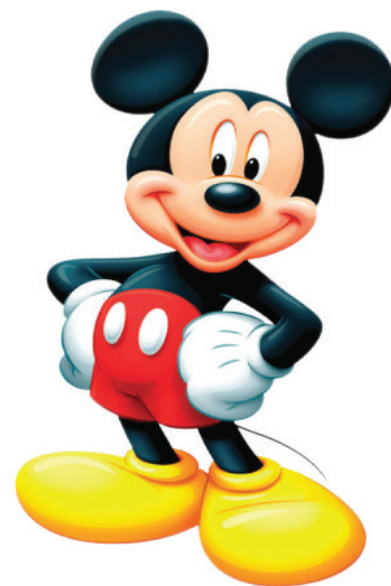
Hình ảnh chuột Mickey hiện đại.