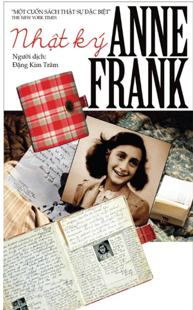
Nhật ký của Anne Frank phiên bản tiếng Việt.

Một ví dụ khác là tác phẩm “Nhật ký của Anne Frank” - cuốn nhật ký ghi lại câu chuyện của một cô bé người Do Thái trong khi đang lẩn trốn cùng gia đình ở thời kỳ