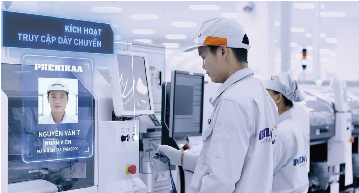
Phenikaa Electronics áp dụng hệ thống kích hoạt và kiểm soát dây chuyền sản xuất bằng QR code - một trong những giải pháp sản xuất thông minh với tính năng bảo mật vượt trội.